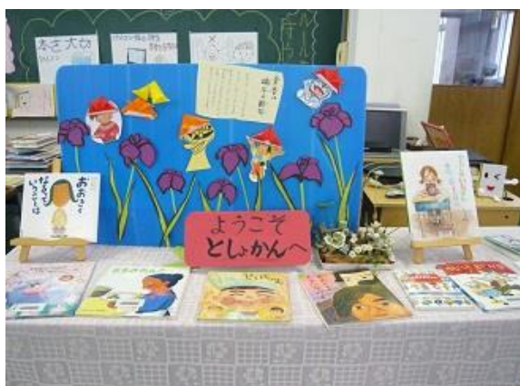
おすすめ本コーナー (小学校)