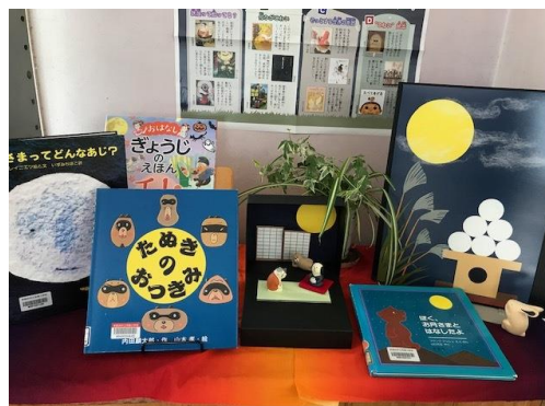
「お月見」季節行事の展示