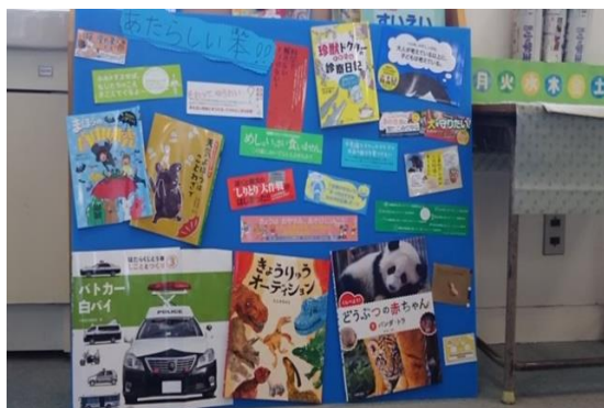
新刊紹介コーナー

新刊の購入や新刊紹介コーナーの設置、図書の貸出返却、傷んだ本の修理や廃棄本の処理等を行います。学校図書館を利用する子どもたちが、気持ちよく読書ができるように支援します。