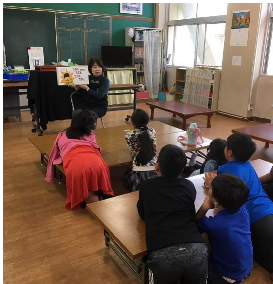
ボランティアによる「おはなし会」(放課後児童クラブ)

今後も、各学校や地域の実情に応じて長期休業中に放課後児童クラブで学校図書館を利用した読書の時間を設けたり、市立図書館や読み聞かせボランティア等の協力を得ながら、読書行事を実施したりするなど、市立図書館、学校と連携して読書環境の充実に努めます。