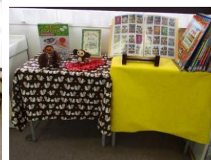
秋の展示コーナー