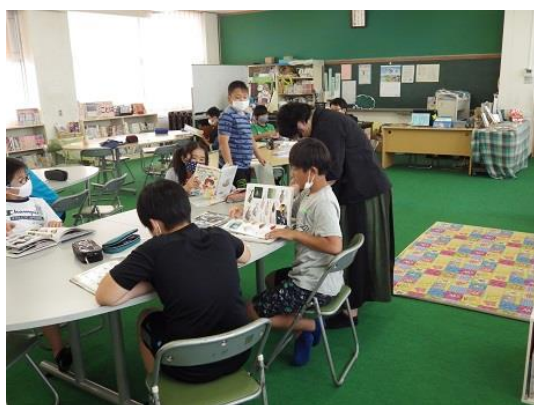
6年生国語「本は友達」の授業

各教科と関連した学校図書館活用年間指導計画を作成し、学級担任と連携して学校図書館を活用する授業支援を行います。学校司書による読み聞かせやブックトーク、国語科だけでなく社会科・理科・総合的な学習の時間の授業等へも積極的に学習支援に関わります。