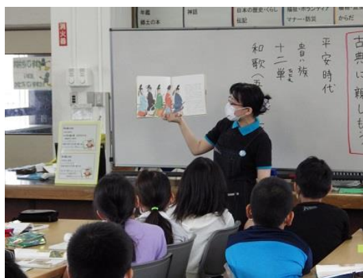
5年生国語「古典に親しもう」の授業