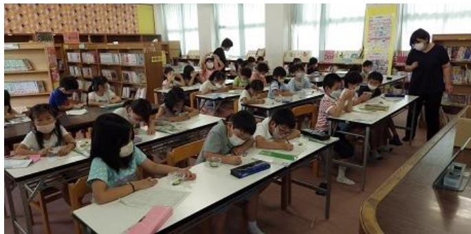
担任と学校司書による図書館での授業の様子

今後、地域への学校図書館の開放についても、安全面やプライバシーの保護などに配慮しながら検討を進め、各校の実情に応じて放課後児童クラブや放課後まなび塾等の放課後対策事業でも活用を図ります。