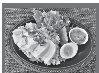
お鍋で和風 カオマンガイ