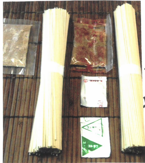
左が今の万長ラーメン。 右がスープ、コショウ、スパイスが別入りの昔の万長ラーメン。

万長ラーメンを復活させるにあたって お客さんに「変わった」と思われるのが嫌でした。 そのため、味だけではなく、パッケージや梱包用の 段ボールも当時の物を探し、同じように作りました。 しかし、昔はスープ、コショウ、スパイスが別入りでしたが 今は、一つのスープの中に全部入れてあります。