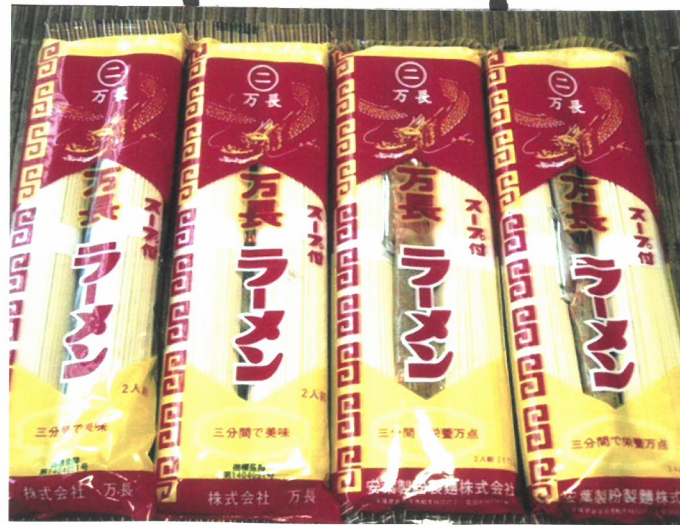
昔の万長ラーメン

昔のパッケージには、栄養 成分と書かれていたけど、 規制が厳しくなり、美味に 変更された。