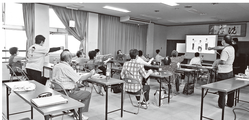
元気もりもり教室の活動の様子