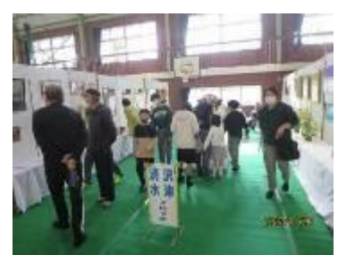
自治会展示コーナー