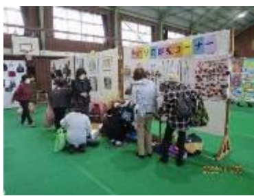
サークル展示の様子