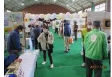
体育館展示の様子