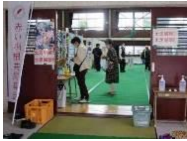
体育館入口の様子