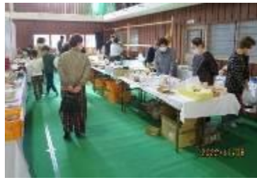
公民館遊休品販売