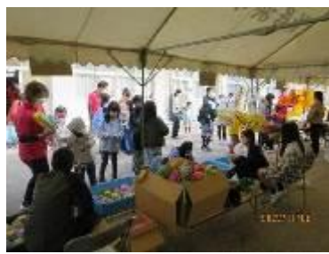
高津小学校くじ引き