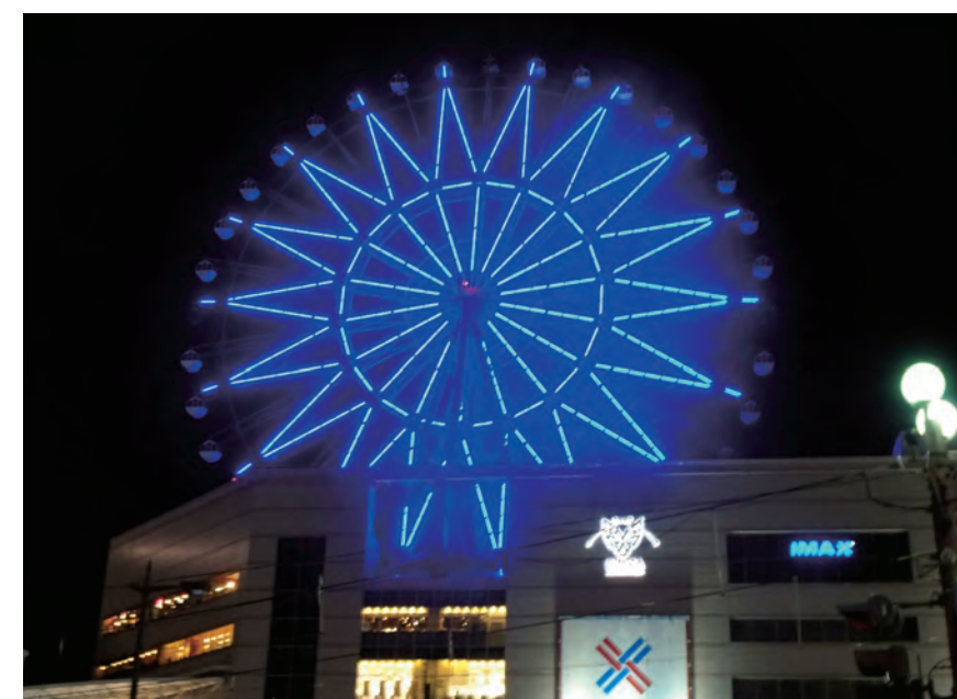
アミュプラザ鹿児島 観覧車「アミュラン」(鹿児島市)

後援：厚生労働省、スポーツ庁、日本医師会、日本歯科医師会、日本糖尿病対策推進会議、健康保険組合連合会、国民健康保険中央会、日本腎臓学会、日本眼科医会、日本看護協会、日本病態栄養学会、健康・体力づくり事業財団、日本健康運動指導士会、日本糖尿病教育・看護学会、日本総合健診医学会、日本糖尿病財団、日本糖尿病療養指導士認定機構、鈴木万平糖尿病財団、日本内科学会、日本内分泌学会、日本小児科学会、日本眼科学会、日本臨床内科医会、日本肥満学会、日本循環器学会、日本消化器病学会、日本高血圧学会、日本糖尿病眼学会、日本糖尿病合併症学会、日本糖尿病・妊娠学会、日本臨床検査医学会、日本糖尿病理学療法学会、日本くすりと糖尿病学会、日本老年医学会、日本サルコペニア・フレイル学会、東京都、東京都医師会、東京都糖尿病対策推進会議、日本栄養士会、日本薬剤師会、日本病院薬剤師会、日本臨床衛生検査技師会、健康日本21推進全国連絡協議会、日本健康会議