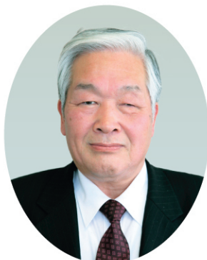
市長 石川 勝行