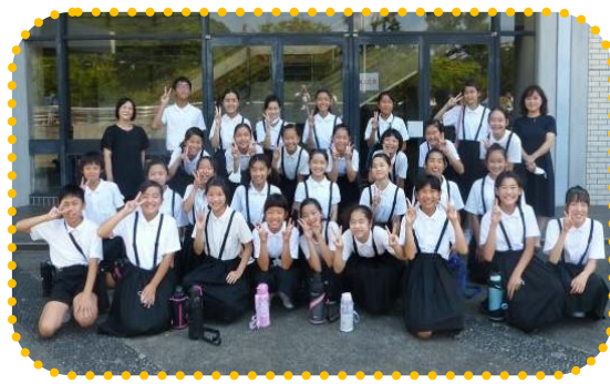
高津小学校合唱部の皆さん

今年のNコンのキャッチフレーズは、「歌を力に変えていく」だそうです。暗いニュースの多い中、また、コロナが未だ収束しない閉塞感の中、このような明るいニュースに触れ、地域の私たちも確実に力づけられました。ありがとうございます。