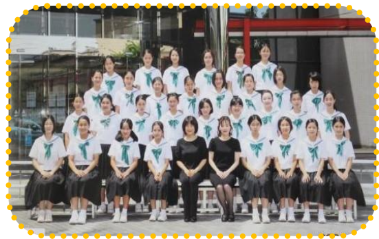
東中学校音楽部の皆さん