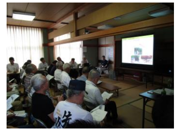
7/20 大島まちづくり校区懇談会の様子