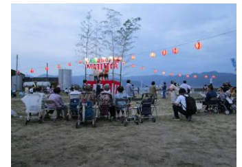
8/14 昨年の夏祭りの様子