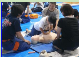
消火器操作訓練 救命処置訓練