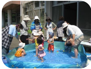
7/9のプール遊びの様子です