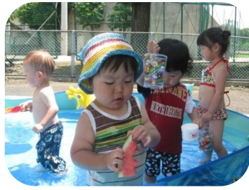
7/11のプール遊びの様子