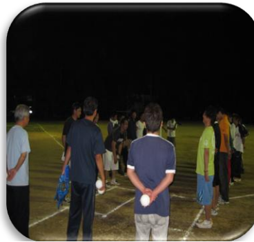
選手の皆さんお疲れ様でした。