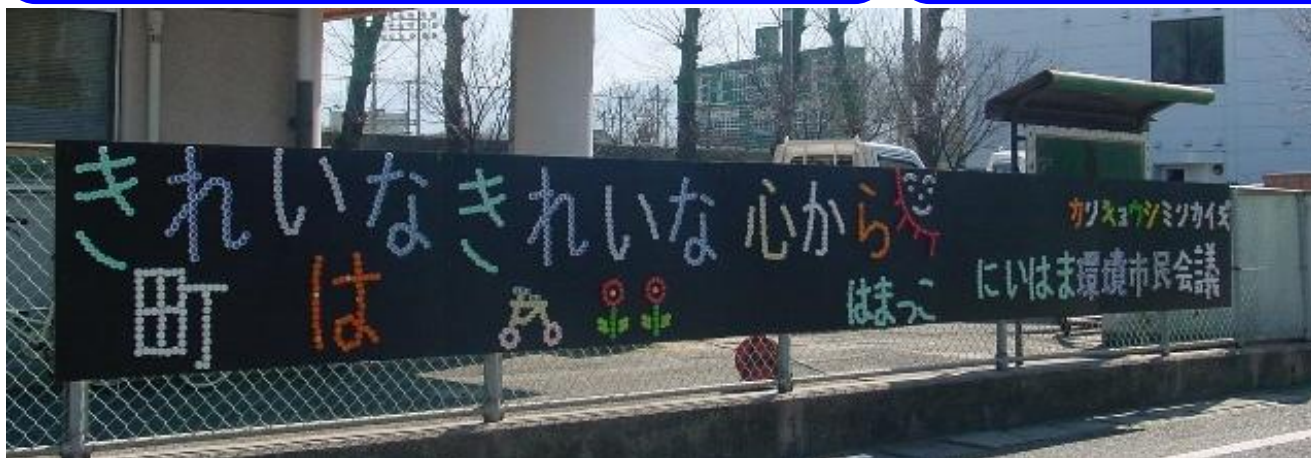
きれいな町は きれいな心から はまっこ