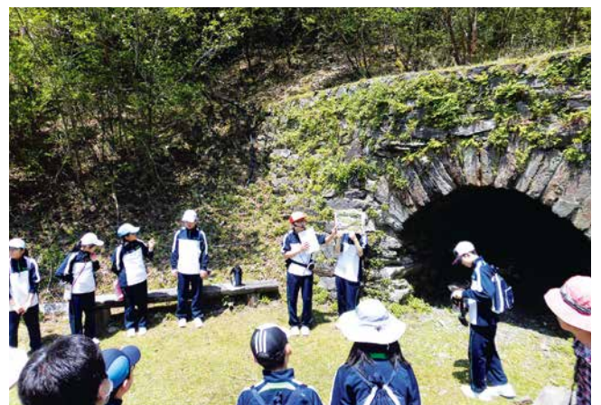
別子中学校登山学習の様子