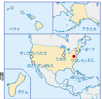
平成28年度 中学生国際交流事業アメリカ訪問団 日程