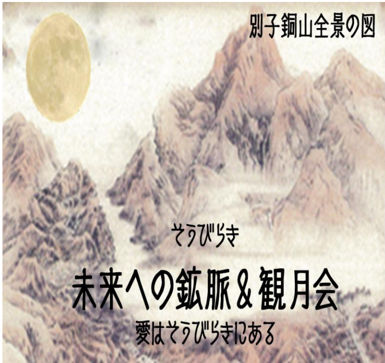
別子銅山全景の図