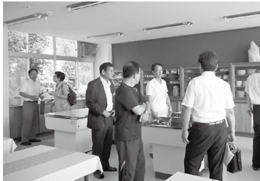
大島交流センター(調理室兼食堂)

8月11日(火)に委員会を開催し、平成27年4月から旧大島小学校に開設された大島交流センターの現地調査を行いました。現地では施設の概要や利用状況などについて、市担当局から聞き取り調査を行いました。