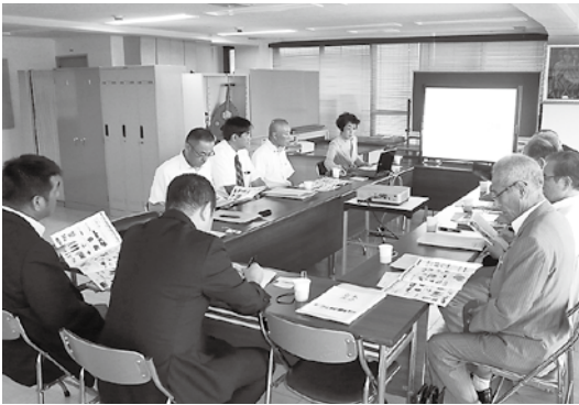
岩本商会での質疑応答

8月11日(火)に委員会を開催し、継続審査となっている請願5件の審査と、消防自動車購入に係る調査のため、購入先である株式会社岩本商会(松山市)で聞き取り調査を行いました。