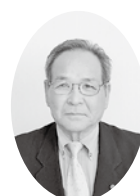
高橋 一郎 議員 (自民クラブ)