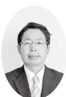
高塚 広義議員 (公明党議員団)