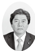
近藤 司議員 (自民クラブ)